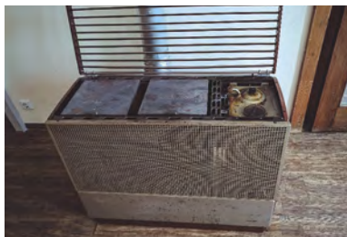
Derzeitige „Heizungsanlage“ in der Alten Schule