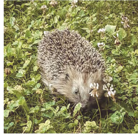
Braunbrustigel Susi

in Siedlungsbereichen zu Hause. In unseren bis in die letzte Ecke gepflegten Gärten finden sie kein Plätzchen, um zu überwintern oder ihre Jungen aufzuziehen. Oft sind dann nur Schnecken im Angebot. Auf dem Speiseplan des Igels stehen aber an oberster Stelle Insekten oder Würmer, gerne mal einen Laufkäfer. Die gibt es in unseren aufgeräumten Gärten oft nicht mehr. Dass einseitige Ernährung nicht gesund ist, wissen wir in der Zwischenzeit alle.