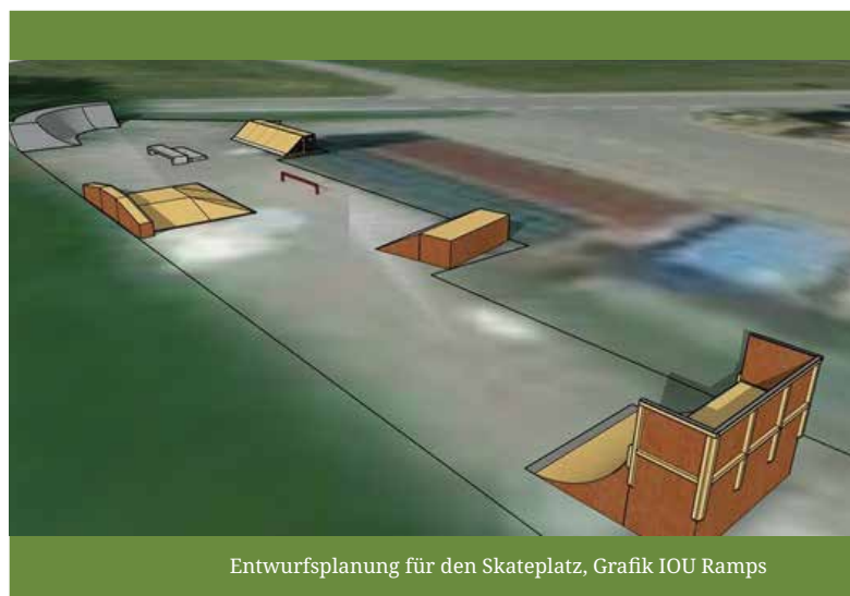
Entwurfsplanung für den Skateplatz, Grafik IOU Ramps

Man überlegt nun, den stärker frequentierten Boden in der Bücherei lackieren zu lassen. Dann hätte man für viele Jahre Ruhe. Eine professionelle Reinigung und Aufbringung einer neuen Öl-Lasur müsse hier wohl jährlich erfolgen. Eine Lackierung wäre ohne Restaurierung über viele Jahre haltbar. Je nach Umfang der Arbeiten lägen die Kosten bei 2.500 € - 6.700 €.