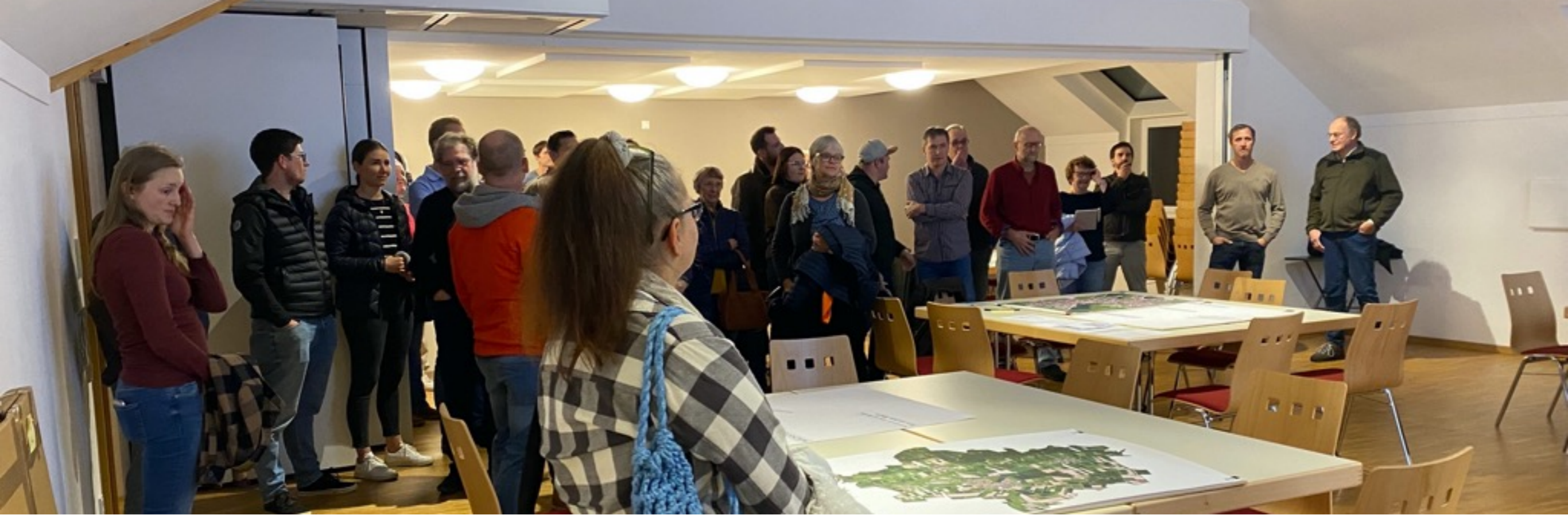
BILDER VON DER VERANSTALTUNG - ES FREUT UNS SEHR, DASS SO VIELE BÜRGERINNEN UND BÜRGER DIE ZUKUNFT VOM MARKT WAAL MITGESTALTEN!